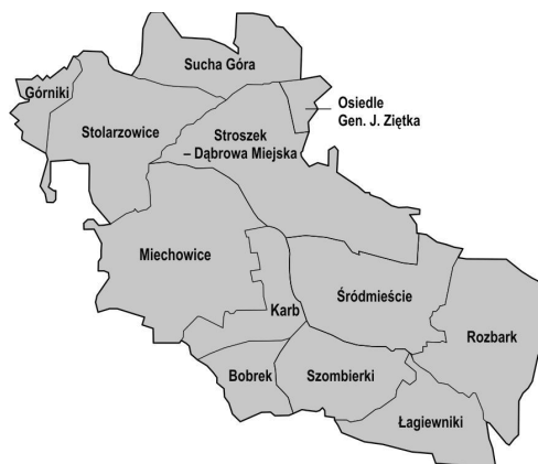
Ryc. 5. Dzielnice Bytomia*