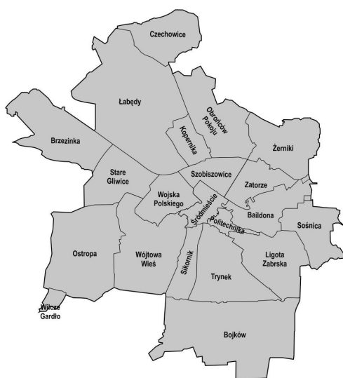
Ryc. 4. Jednostki pomocnicze Gliwic