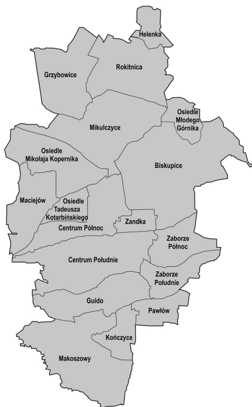
Ryc. 3. Jednostki pomocnicze Zabrze

się kompozycją urbanistyczną i wartościami architektonicznymi [Wojnarowska 2017: 36]. Centrum powinno stanowić o tożsamości samego miasta, być jego wizytówką, odzwierciedlającą jego atrakcyjność. Wpływać powinno na odczucia integracji mieszkańców całego miasta, powinno być miejscem wielofunkcyjnym, o wysokiej jakości przestrzeni i usług publicznych, [Wojnarowska 2017: 37, 38] atrakcyjnym dla mieszkańców samego centrum, jak i jego użytkowników. Jednak funkcje centrów miast ulegają zmianie, ich sposób zagospodarowania wpływa na atrakcyjność lokalizacji w ich obszarze usług, handlu i obiektów kulturalnych [Bernaciak 2015: 266]. Trudności z dostępnością komunikacyjną do centrów skutkuje na zmianę lokalizacji działalności gospodarczej przedsiębiorstw sytuujących się poza ich obrębem, tworząc nowe obszary handlu i usług. Pojawiają się więc wyspecjalizowane ośrodki miejskie, produkcyjne, biurowe, rozrywkowe, handlowe [Podhalański 2008: 71, 74]. Przestarała tkanka mieszkaniowa, koszty życia w centrum miast powodują wyludnianie się centrów i większą skłonność mieszkańców do osiedlania się w strefach podmiejskich,