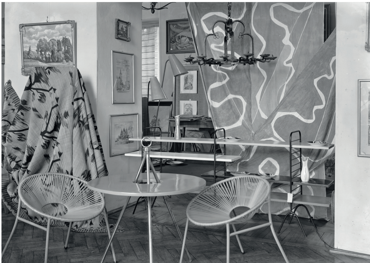
1. Salon Desy przy pl. Kościuszki we Wrocławiu, 1958

Przedsiębiorstwo Państwowe „Desa” – Dzieła Sztuki i Antyki zostało powołane do życia 3 kwietnia 1950 r. decyzją Ministra Kultury i Sztuki (MKiS) w porozumieniu z przewodniczącym Państwowej Komisji Planowania Gospodarczego, ministrem finansów oraz ministrem handlu wewnętrznego i pozostało podległe resortowi kultury i sztuki 8 . Jego siedzibą była Warszawa, ale miało ono prawo tworzyć i prowadzić oddziały na terenie całego kraju. Wraz z ich powstawaniem zostało podzielone na terenowe delegatury, którym podlegały salony w poszczególnych ośrodkach. Do 1953 r. powołano delegatury w Warszawie, Krakowie, Poznaniu, Łodzi, Wrocławiu i Gdańsku, którym podporządkowanych było dwanaście salonów antykwarskich i sztuki współczesnej oraz pięć pracowni konserwatorskich 9 . W toku przekształceń delegatury zredukowano do czterech oddziałów funkcjonujących w latach 80. i 90. (Warszawa, Kraków, Sopot, Katowice).