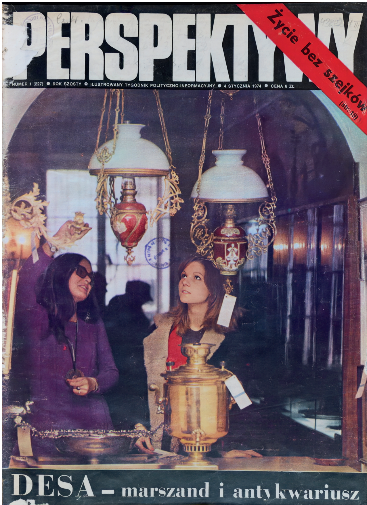
5. Okładka czasopisma „Perspektywy” z 1974 r., nr 1, fot. T. Sikora