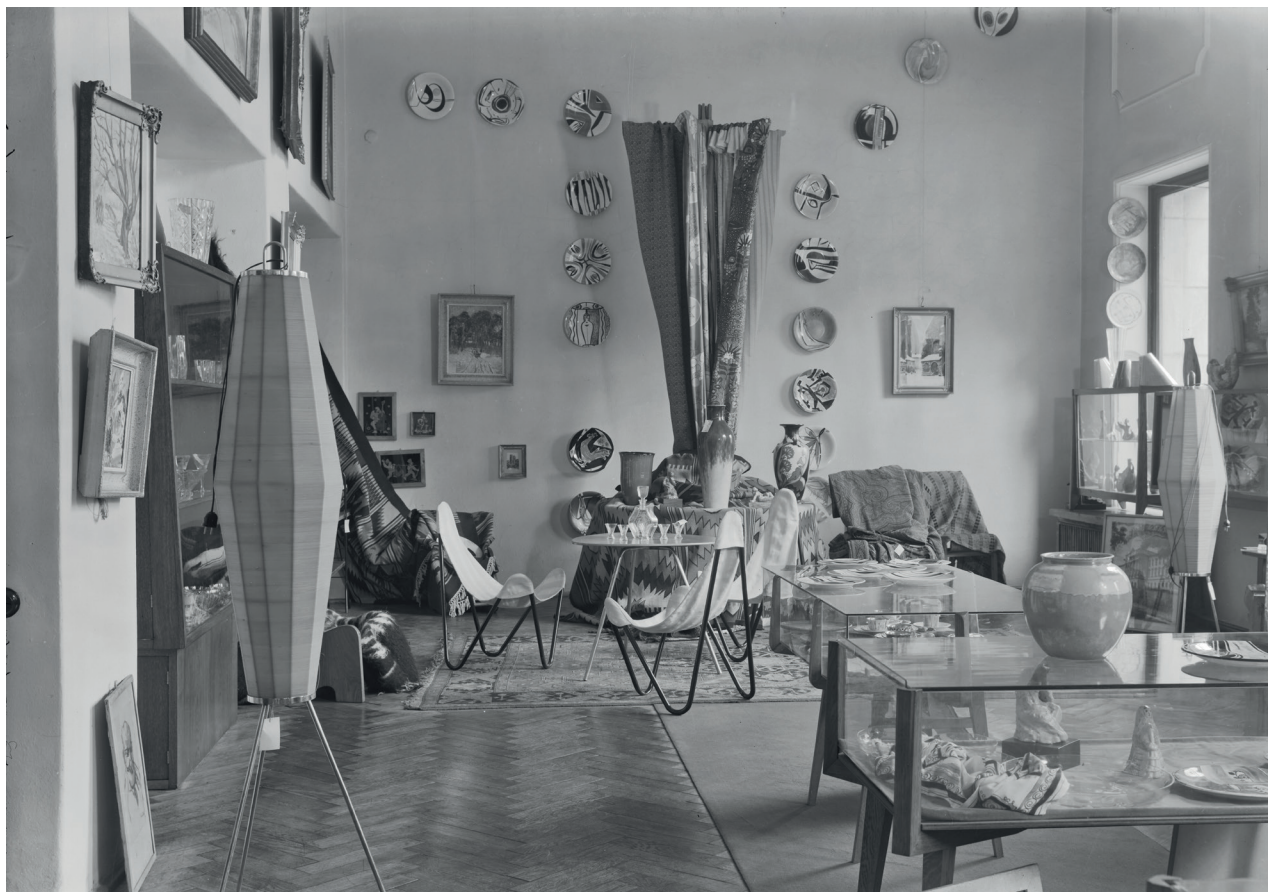
2. Salon Desy przy pl. Kościuszki we Wrocławiu, 1958

Przedmiotem działalności Desy było kupno i sprzedaż na rachunek własny oraz komisowy dzieł sztuki i przedmiotów artystycznych, a także ich konserwacja, reprodukcja oraz opiniowanie autentyczności i ocena wartości. Przedsiębiorstwo było prowadzone w ramach narodowych planów gospodarczych, według rozrachunku gospodarczego i rozliczeń poprzez budżet centralny państwa i to przez państwo zostało uposażone w sklepy i warsztaty. Dyrektora Desy powoływał minister kultury i sztuki 10 . Te zadania z biegiem lat ulegały precyzowaniu i poszerzaniu 11 . W latach 60. Desa została ponadto zobligowana do inspirowania twórczości plastycznej, wytwórczości artystycznej i chałupniczej, produkcji mebli stylowych, do organizacji sprzedaży dzieł sztuki także na rynku zagranicznym, urządzania wystaw, targów i kiermaszów w kraju i za granicą 12 .