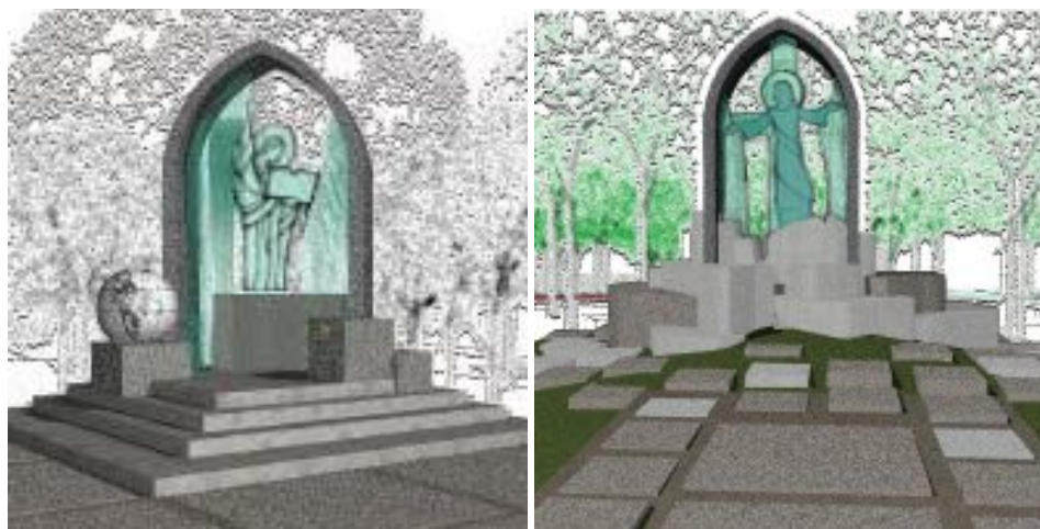
Fot. 11–12. Stacje Tajemnic Światła w Panewnikach. Proj. architektoniczny: inż. arch. Tadeusz Stolarczyk, proj. witraża: art. malarz Małgorzata Toborowicz, 2009. Praca niepublikowana, reprodukcja za zgodą Autorów

Phot. 11–12. Stations of the Mysteries of Light in Panewniki. Architectural design by inż. arch. Tadeusz Stolarczyk, stained glass design by painter Małgorzata Toborowicz, 2009. Unpublished work, reproducer by permission