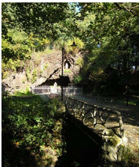
Fot. 2. Fragment parku z Grotą Lourdzką autorstwa pracowni Bauma w parku sakralnym w Panewnikach. Fot. M. Swaryczewska 2009

Phot. 1. The basilic of Franciscans in Katowice, Panewniki (1905–1908). Photo by M. Swaryczewska 2008