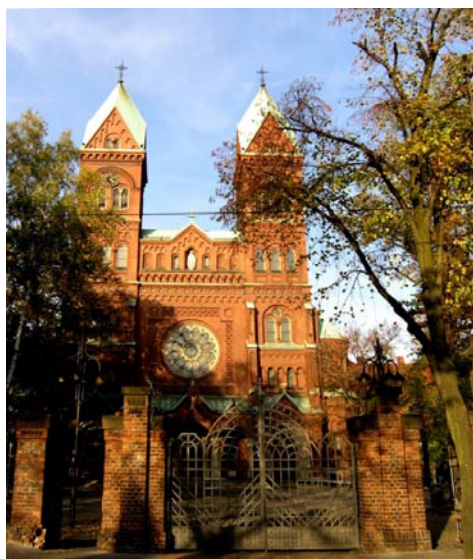
Fot. 1. Bazylika OO. Franciszkanów w Katowicach Panewnikach (1905–1908).

Początki omawianego założenia sakralnego, zlokalizowanego nad rzeką Brynicą, na granicy wsi Panewnik i Ligota, wiążą się z działalnością franciszkanów. Przybyli oni na Śląsk jeszcze w XIII w., byli też pierwszym zakonem, jaki powrócił tu do pracy duszpasterskiej po okresach represji i ustawach sekularyzacyjnych w czasie wojen napoleońskich i Kulturkampfu [Gierlotka 2008]. W 1900 r. franciszkanie wybrali wieś Panewnik na nową siedzibę, kierując się koniecznością stałej pracy duszpasterskiej wśród robotników tutejszych kopalń i hut [Kopp 1908]. Szybko też postępową budowa klasztoru i monumentalnego kościoła (1905–1908), o okazałych, ceglanych fasadach, utrzymanego w stylistyce neoromańskiej (fot. 1). „Nadzwyczaj rażno postępuje to śliczne dzieło. Albowiem minęły dopiero 2 lata od położenia kamienia węgielnego, a już kościół i klasztor bliski jest ukończenia...” – napisał ks. kard. Józef Kopp [1908].