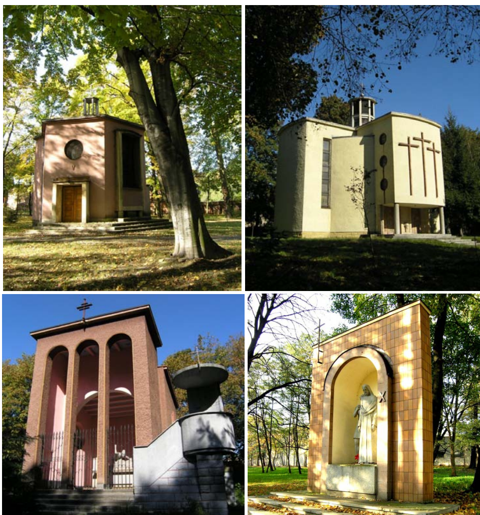
Fot. 5–8. Stacja V., Głgota (Stacja XI, XII. i XIII) oraz Stacja IX. i Stacja X. Kalwarii Panewnickiej, autorstwa arch. Jana Kruga i arch. Tadeusza Brzozy (1936–1939).

2008]. Starania te niewątpliwie przyczyniły się do szybkiego postępu robót. Tuż przed wybuchem II wojny światowej stacje Kalwarii Panewnickiej były w większości ukończone, choć część z nich wzniesiono już po wojnie i wraz z kaplicą Grobu Bożego poświęcono dopiero w 1953 r. [Pyka 2003, Gierlotka 2008]. Powstała więc jedyna w swoim rodzaju kalwaria, całkowicie osadzona w estetyce okresu międzywojennego (fot. 5–8). Pewną niekonsekwencją stylową wprowadza natomiast zawikłana, miejscami naturalistyczna kompozycja samego parku, daleka od jednolitej, charakterystycznej dla modernizmu dyscypliny formalnej.