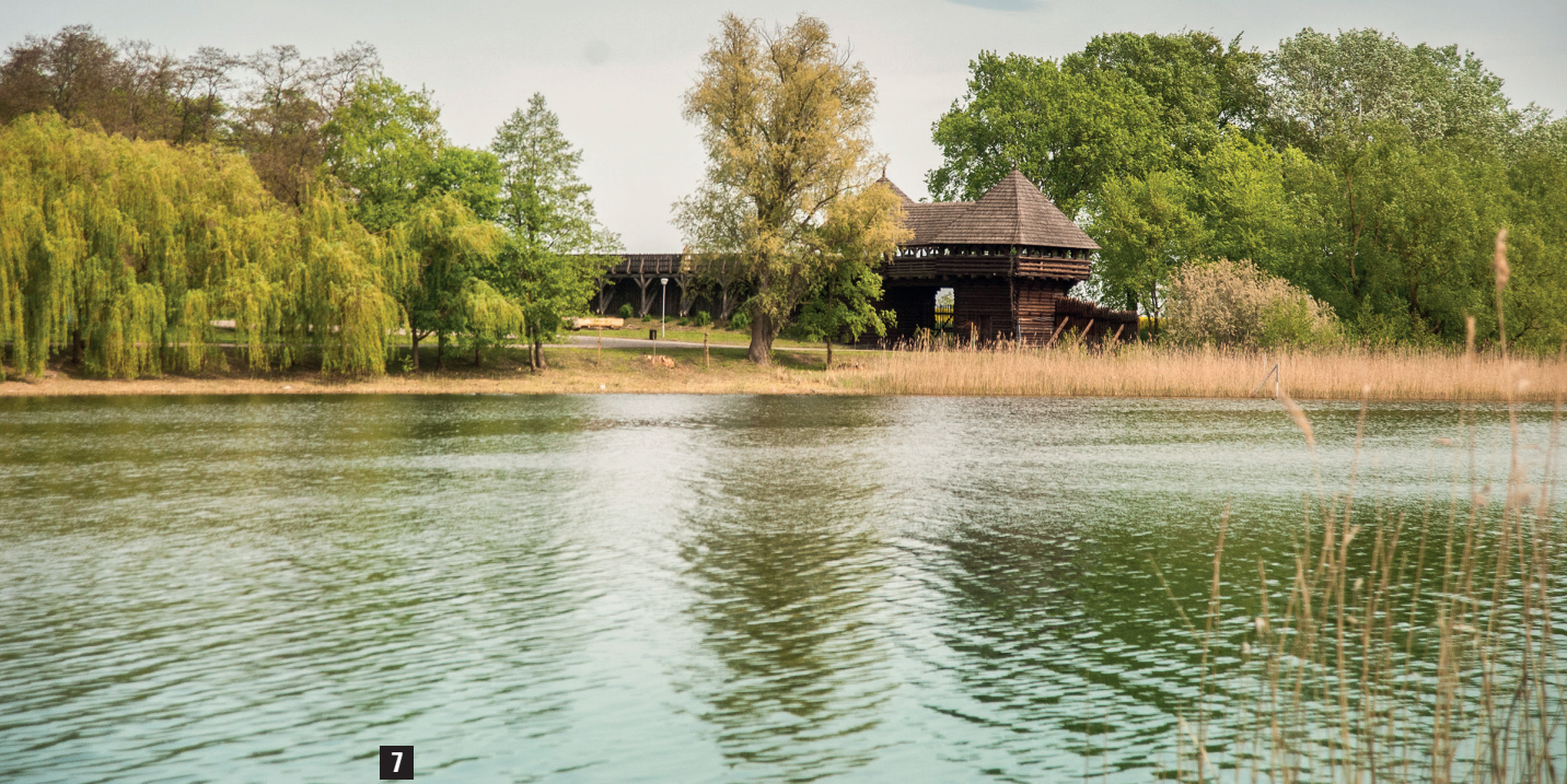
Fot. 7 Współcześnie na Ostrów Lednicki można się dostać promem, a teren przystani jest chroniony palisadą i potężną bramą