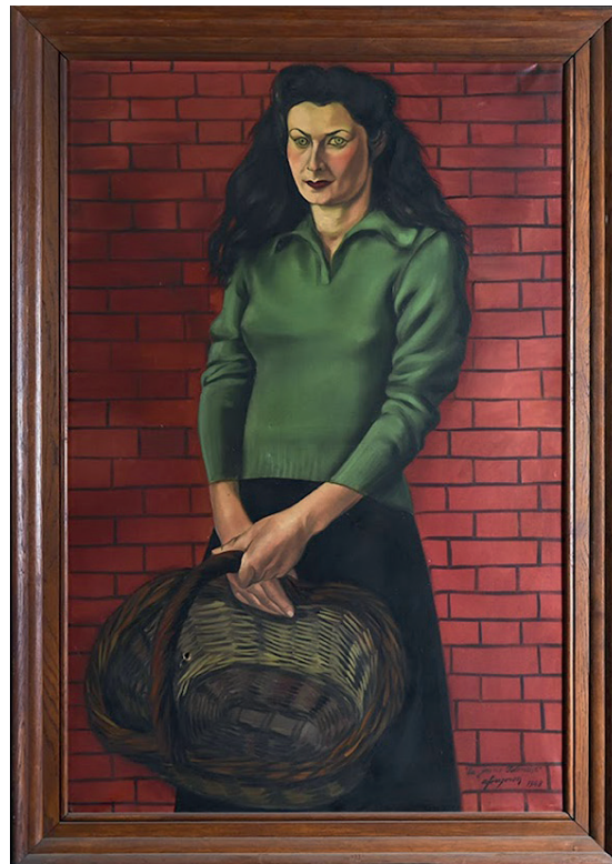
1. A. Fougeron, Młoda Polka , olej, płótno 1948