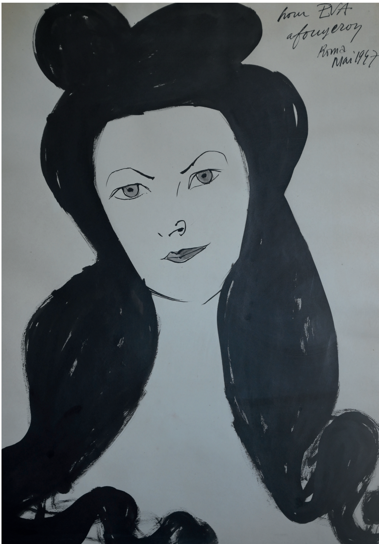
7. Rysunek tuszem A. Fougerona, Ewa Garztecka 1947