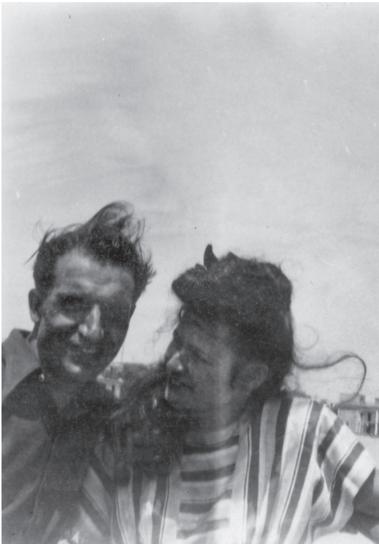
5. André Fougeron i Ewa Garztecka, 1947