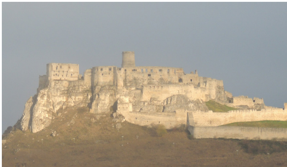
Abbildung 6. Die Zipser Burg

Das Zentrum der Besitzungen der Familie Csáky in der Zips war die auf einem Hügel im Einzugsgebiet des Flusses Hernad errichtete Zipser Burg (slowakisch Spišský hrad , ungarisch Szepesvár ) im Süden des Komitats.