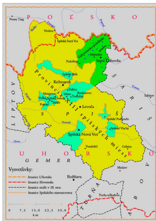
Abbildung 1. Die Zips in der Zeit von 1412 bis 1772

1918 territorial stark verkleinerten Ungarn verursachte. Dies spiegelt auch die kunsthistorische Forschung der damaligen Zeit in erheblichem Maße wider. Je nach Verfasser wurden die Kunstdenkmäler in der Zips nicht selten als Ausdruck polnischer, slowakischer, ungarischer oder deutscher Identität interpretiert und in gewisser Weise auch als Argument für einen jeweils unterschiedlichen Grenzverlauf herangezogen. 10