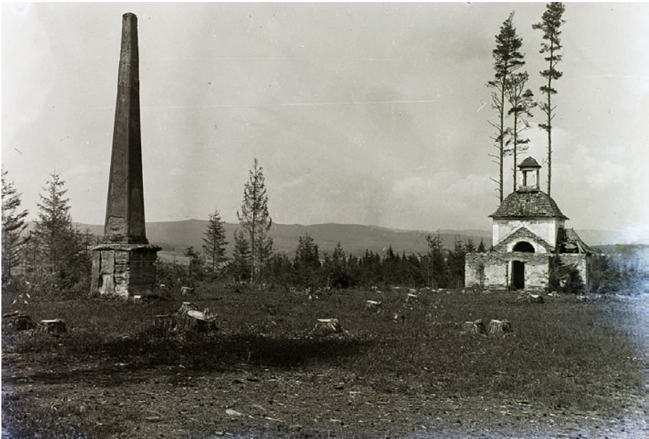
Abbildung 7. Iliašovce, Obelisk und Kapelle des Heiligen Stephans im einstigen Park des Schlosses Sans Souci, Foto aus dem Jahr 1932

Katholizismus treu blieb. 96 Als weitere Gründe für die Entfremdung der Eheleute führen die Wissenschaftler Júlia Verschwendungssucht sowie auch den Tod ihrer mutmaßlichen Tochter an, wengleich die Historiker hinsichtlich deren Existenz keine Gewissheit haben. 97 Wie auch immer: Ab 1785 hielt sich István zunehmend in Humenné (deutsch Homenau , ungarisch Homonna ) auf, während Júlia zu ihrer Familie nach Pressburg zog und die Zips nur noch in den Sommermonaten besuchte. 98 Obwohl das Sommerschloss in Iliašovce nur wenige Jahrzehnte bestand und sein Aussehen nicht detailliert dokumentiert wurde, bleibt das Zipser Sans Souci ein bemerkenswertes Werk als eine Art Experiment, das das Bild der eher konservativen Architektur der Residenzen in dieser Region interessanterweise diversifiziert.