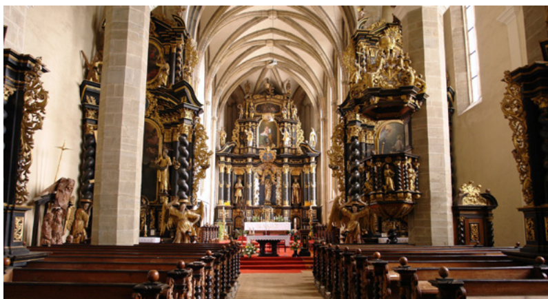
Abbildung 3. Levoča, Kirche der Jungfrau Maria, Königin der Engel und St. Ladislaus

Es ist festzustellen, dass ein solches Vorgehen – die Einbindung eines mittelalterlichen Reliefs oder einer Skulptur in einen frühneuzeitlichen Altar – in der Kunst sowohl im ungarischen als auch im polnischen Teil der Zips ziemlich populär wurde. Ein weiteres Beispiel dafür ist auch das „Flaggschiff“ der Zipser Gegenreformation, die Neugestaltung der einstigen Minoritenkirche, der nunmehrigen Kirche der Jungfrau Maria, Königin der Engel und St. Ladislaus (ursprünglich war sie nur dem heiligen Ladislaus geweiht) in Levoča. Diese Kirche wurde im letzten Viertel des 17. Jahrhunderts von den Jesuiten übernommen. Die Ausstattung wurde vom schwedischen Tischler Olaf Engelholm und lokalen Bildhauern gefertigt.