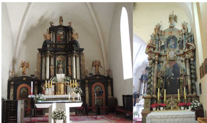
Abbildung 4. Spišský Štvrtok, Kirche des Heiligen Ladislaus, Hauptaltar und Seitenaltar, der dem Heiligen Antonius von Padua geweiht ist

Der in der Kirche erhalten gebliebene Hauptaltar – er ist dem heiligen Ladislaus geweiht – stammt aus dem Jahr 1704. Die Kanzel wurde von 1714 bis 1721 errichtet, nach 1735 entstanden die dem heiligen Franz von Assisi und dem heiligen Antonius von Padua geweihten Seitenaltäre. Möglicherweise ersetzten diese die unmittelbar nach der Niederschlagung des Aufstands errichteten provisorischen Seitenaltäre. 41