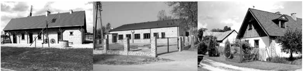
Fot. 4. Przykłady współczesnego zastosowania kamienia wapiennego w budownictwie

W omawianym regionie spotykane są w zasadzie wszystkie podstawowe typy murów. Bardzo popularny, mimo że wymagający największych nakładów pracy, był