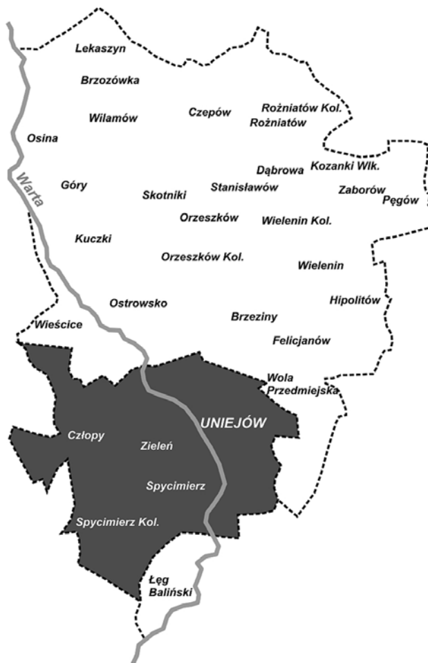
Ryc. 1. Zasięg ochrony uzdrowiskowej w gminie Uniejów

Do innych inwestycji mających na celu poszerzenie oferty usługowej na terenie miasta należą przede wszystkim: skansen etnograficzny „Zagroda Młynarza” z zapleczem gastronomiczno-noclegowym, kompleks edukacyjno-turystyczno-rekreacyjny Kasztel Rycerski „Na Gorących Źródłach”, Dom Pracy Twórczej Akademii Sztuk Pięknych w Łodzi, kompleks sportowo-rekreacyjny i nowy plac targowy. Z dominującym na terenie Uniejowa kierunkiem rozwoju w ofercie usługowej korespondują nowo powstałe wyspecjalizowane obiekty inwestorów prywatnych – Hotel Uniejów Eco Active & Spa oraz Medical Spa Hotel Lawendowe Termy.