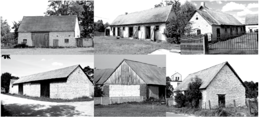
Fot. 2. Przykłady tradycyjnych budynków z kamienia wapiennego – budynki inwentarskie i stodoły