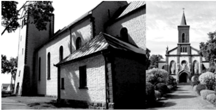
Fot. 3. Kościoły wzniesione z kamienia wapiennego