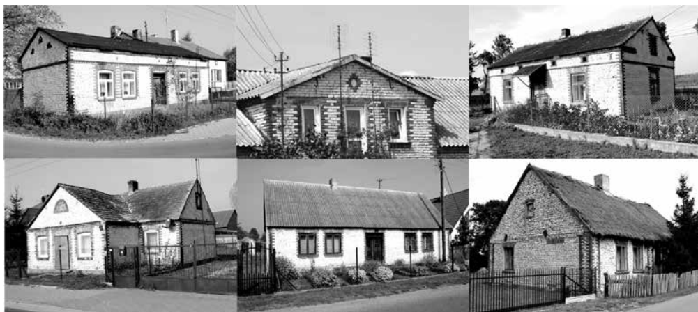
Fot. 1. Przykłady tradycyjnych budynków z kamienia wapiennego – budynki mieszkalne Źródło: [Gorączko, Gorączko] (fot. 1–4).

dóbr. Po ich częściowej parcelacji, była ona z kolei prowadzona przez okolicznych gospodarzy. Szybkemu upowszechnieniu technologii budowy z miejscowego kamienia sprzyjał niski (w porównaniu z cegłą) koszt zakupu tego materiału, łatwość jego obróbki za pomocą prostych narzędzi kamieniarskich, a także trwałość i dobra izolacyjność wzniesionych z niego budynków. Budownictwo murowane z kamienia wapiennego w szybkim tempie wyparło konstrukcje z drewna i innych materiałów budowlanych. Dotyczyło to nie tylko terenów wiejskich, ale także miast, takich jak właśnie Uniejów, ale też pobliskie Dąbie. Kamień wapienny znajdował się w powszechnym użyciu aż do połowy lat 60. XX w. na obszarze całej Kotliny Kolskiej i na przyległych do niej terenach. Stanowił podstawowy materiał konstrukcyjny w budownictwie. Wykonywano z niego mury zarówno chałup (fot. 1), jak i budynków inwentarskich, stodoł (fot. 2), młynów, gorzelni a nawet kościołów (fot. 3). W miejscach wymagających większej wytrzymałości (nadproża, naroża budynków, nawiewniki itd.) często stosowano cegłę. Zabieg ten służył także celom dekoracyjnym, ponieważ uzyskiwano dzięki temu ciekawy efekt kontrastu w obrębie elewacji, zestawiając jasnożółty kamień z czerwoną ceramiką [Gorączko, Gorączko 2013]. Z cegieł wykonywano także elementy ozdobne murów, takie jak symbole religijne, wzory geometryczne itp. Kamień wapienny zestawiano także z łupanym kamieniem polnym, z którego zwykle wykonywano podmurówki budynków.